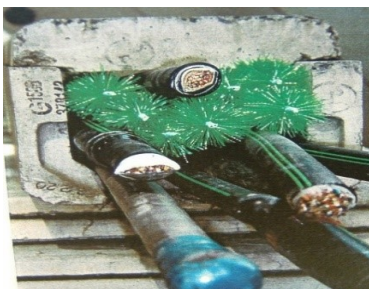
トラフ内での使用状況